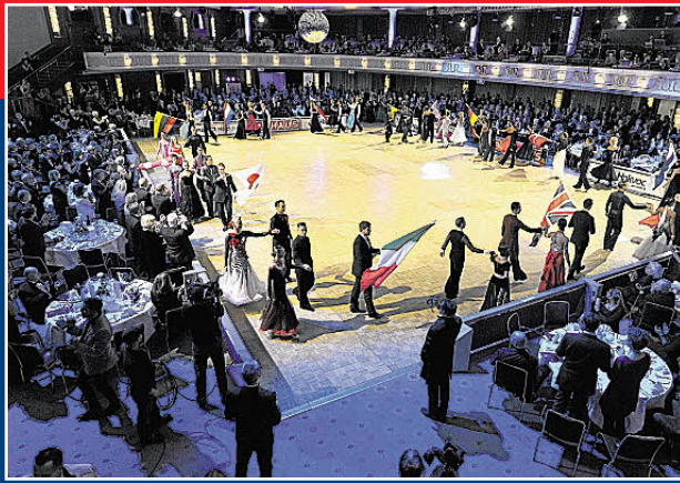
Bewegender Moment auch für die Zuschauer: der Einzug der Nationen