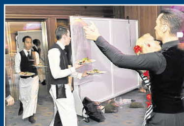
Letzte Probe, während Kellner das Essen servieren gehen.