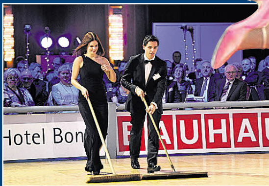
Blitzblank muss das Parkett für Spitzenleistungen sein: In der Pause wird gefegt.