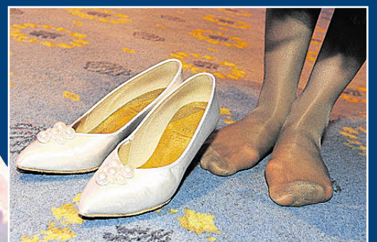
Die Verschnaufpausen für schmerzende Füße waren nur kurz.