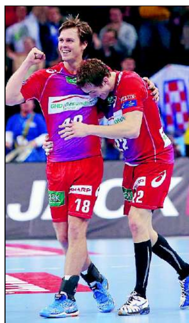
Jubel beim HSV: Hans Lindberg (links) und Kentin Mahe freuen sich über den Sieg.

Spiel nach langer Zeit, wie er bekannte. „Ich habe ein bisschen was vermisst in den letzten zwei Jahren“, gestand der 58 Jahre alte Unternehmer, der das Amt von